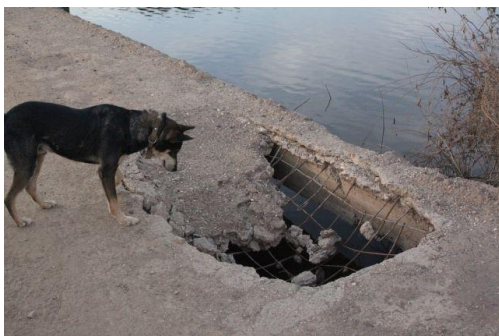
Ja Bas, dat was het oude bruggetje

Er is nu nog maar 1 kunstwerk te gaan.....ja jullie raden het al, onze eigen nieuwe brug op de korte route. Tot nu toe is er nog geen aanstalten gemaakt om te starten. Dus we wachten nog even af.